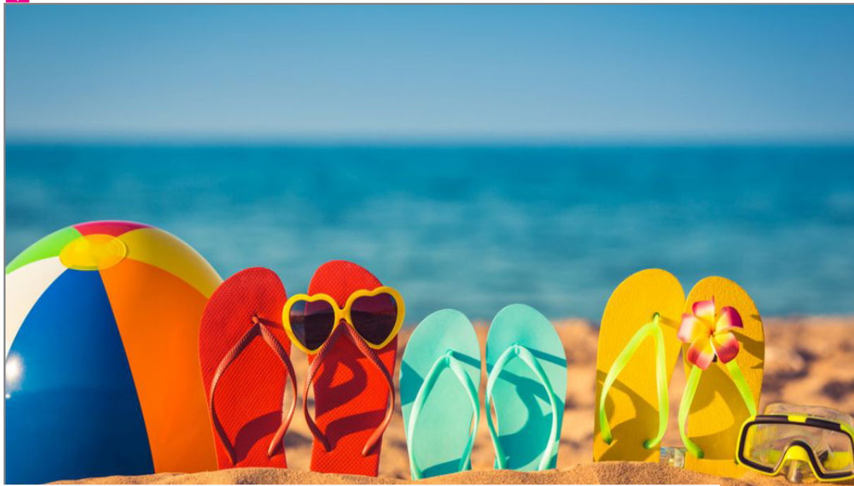
ورود ۱۸ هزار گردشگر به کیش در نخستین هفته از جشنواره تابستانی